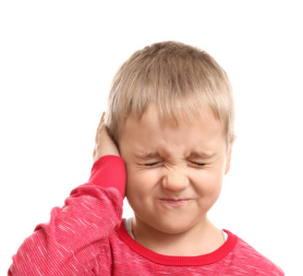
1. Il a mal à l'oreille