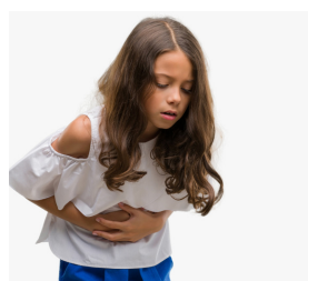
4. J' ai mal au ventre.