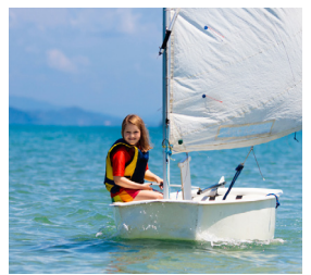
4. la voile