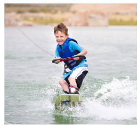
3. le ski nautique