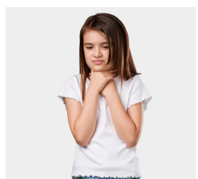
3. Elle a mal à la gorge