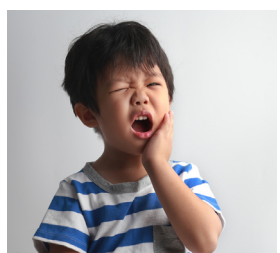
2. Tu as mal aux dents.